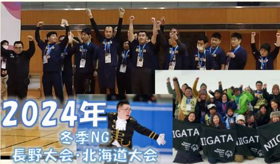
2024年 冬季NG 長野大会・北海道大会