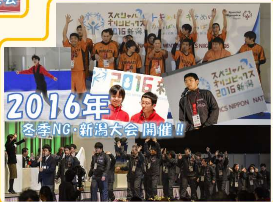
2016年 冬季NG・新潟大会開催!!