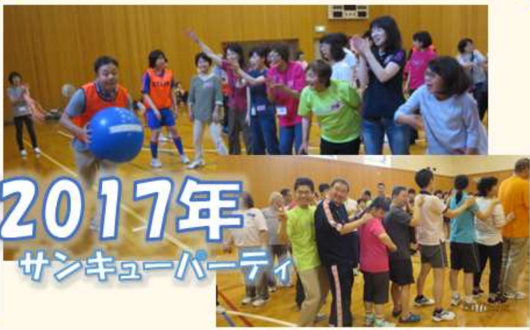
2017年 サンキューパーティー