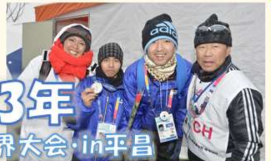
冬季世界大会・in平昌