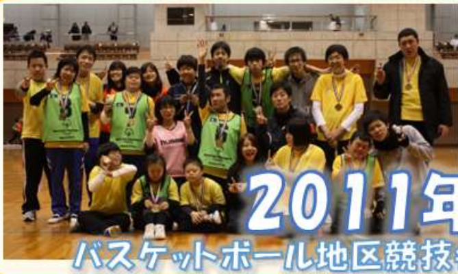
2011年 バスケットボール地区競技会