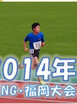
2014年 夏季NG・福岡大会