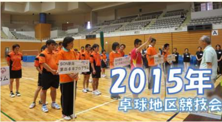
2015年 卓球地区競技会