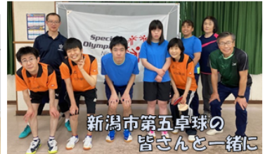
新潟市第五卓球の皆さんと一緒に