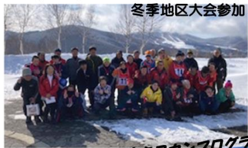
小千谷市クロカンプログラム

プログラム名 氏名 【アスリートキャプテンより一言】 ①~③の中から題名を選んでもらいました! ①プログラムで頑張りたいこと ②プログラムの思い出 ③プログラムの良いところ