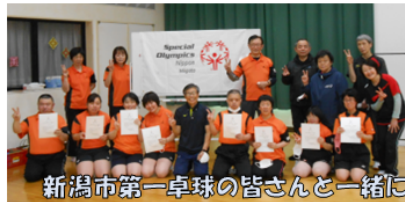
新潟市第一卓球の皆さんと一緒に

これから暑い夏に向かいます。私たちスタッフ一同も、アスリートファーストで、SON・新潟の円滑な運営にいつも以上に汗をかいてまいりたいと思ひますので、引き続きよろしくお願ひします。